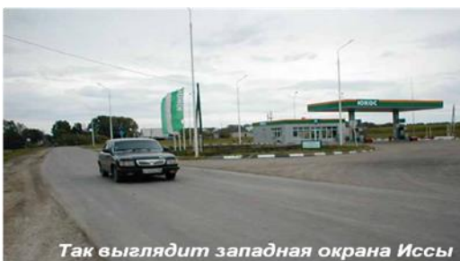
Так выглядит западная окраина Иссы